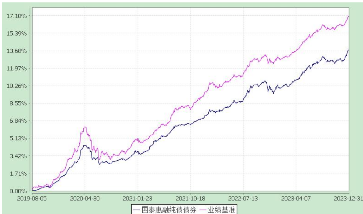
自基金合同生效以来份额累计净值增长率与业绩比较基准收益率的历史走势对比图 (2019 年 8 月 5 日至 2023 年 12 月 31 日)

注：本基金合同生效日为 2019 年 8 月 5 日，在六个月建仓期结束时，各项资产配置比例符合合同约定。