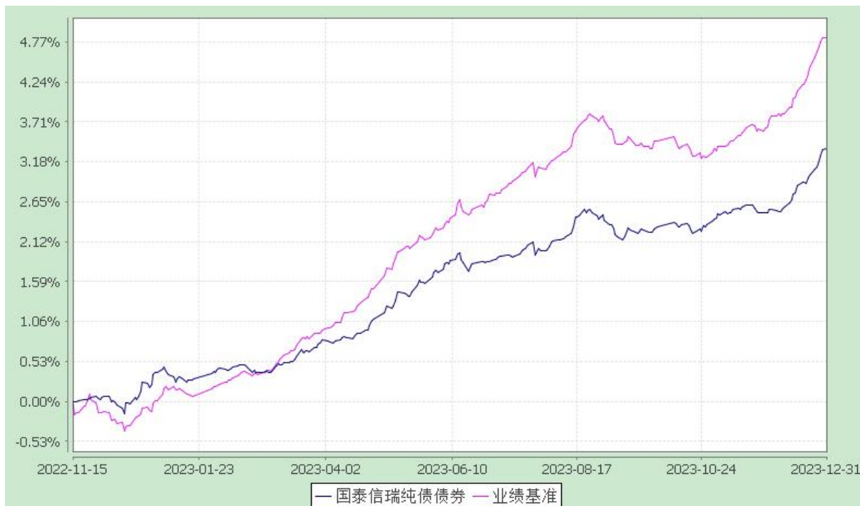
自基金合同生效以来份额累计净值增长率与业绩比较基准收益率的历史走势对比图 (2022 年 11 月 15 日至 2023 年 12 月 31 日)

注：本基金合同生效日为 2022 年 11 月 15 日，在六个月建仓期结束时，各项资产配置比例符合合同约定。