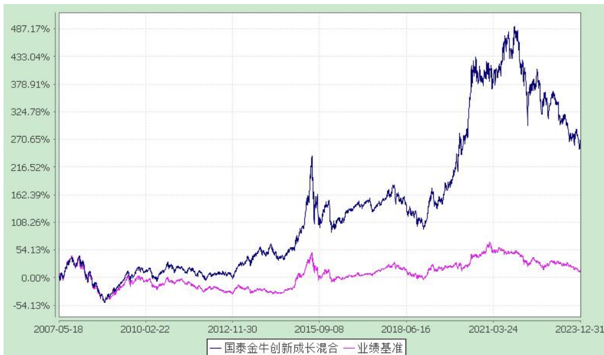
自基金合同生效以来份额累计净值增长率与业绩比较基准收益率的历史走势对比图 (2007 年 5 月 18 日至 2023 年 12 月 31 日)

注：本基金合同生效日为 2007 年 5 月 18 日。本基金在六个月建仓期结束时，各项资产配置比例符合合同约定。