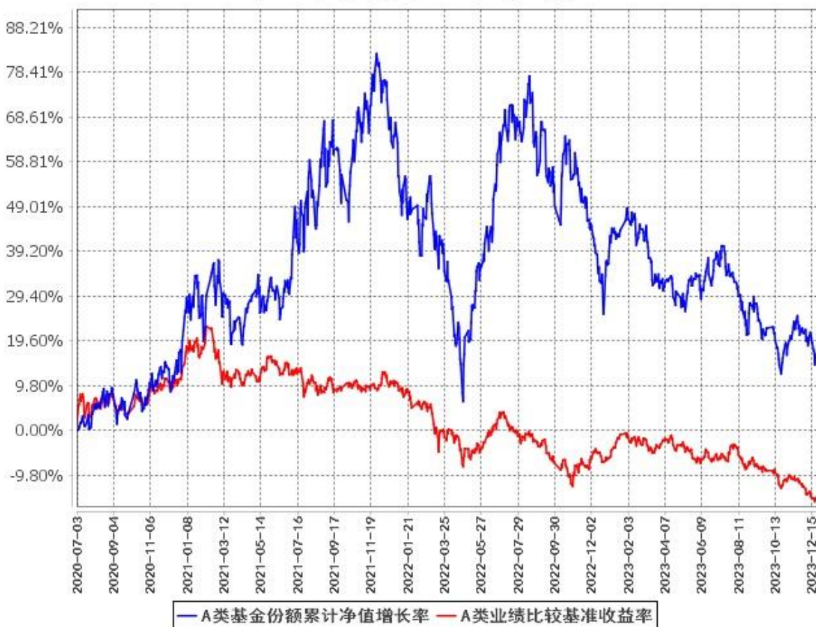
A类基金份额累计净值增长率与同期业绩比较基准收益率的历史走势对比图 (2020年7月3日至2023年12月31日)