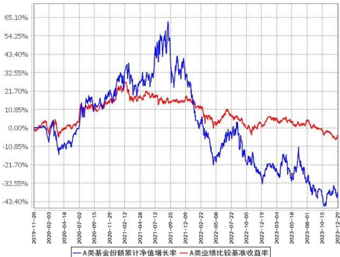
A类基金份额累计净值增长率与同期业绩比较基准收益率的历史走势对比图 (2019年11月20日至2023年12月31日)