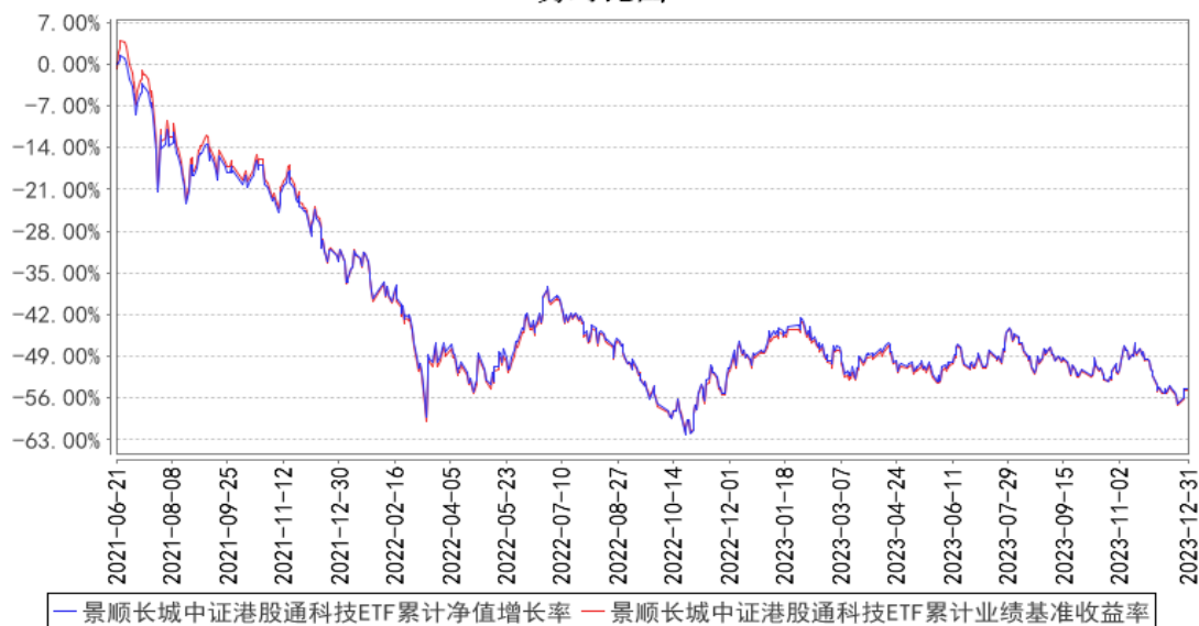
景顺长城中证港股通科技ETF累计净值增长率与同期业绩比较基准收益率的历史走势对比图