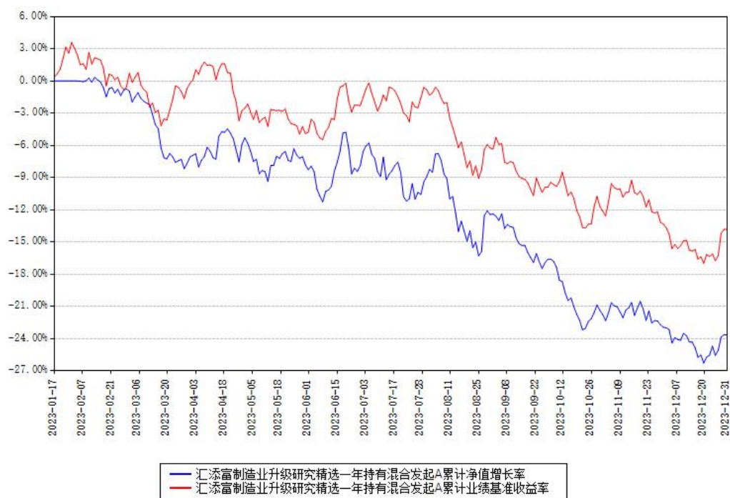
汇添富制造业升级研究精选一年持有混合发起A累计净值增长率与同期业绩基准收益率对比图