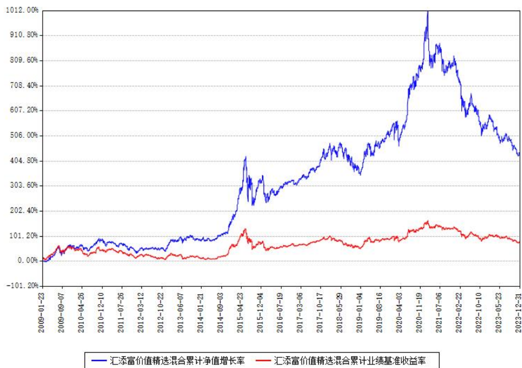
汇添富价值精选混合累计净值增长率与同期业绩比较基准收益率对比图

注：本基金建仓期为本《基金合同》生效之日（2009年01月23日）起6个月，建仓期结束时各项资产配置比例符合合同约定。