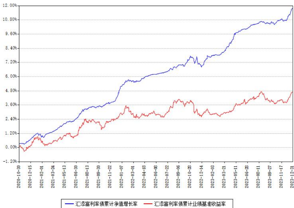
汇添富利率债累计净值增长率与同期业绩基准收益率对比图

注：本基金建仓期为本《基金合同》生效之日（2020年10月30日）起6个月，建仓期结束时各项资产配置比例符合合同约定。