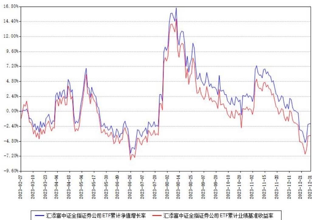
汇添富中证全指证券公司ETF累计净值增长率与同期业绩基准收益率对比图

注：本《基金合同》生效之日为2023年02月27日，截至本报告期末，基金成立未满一年。