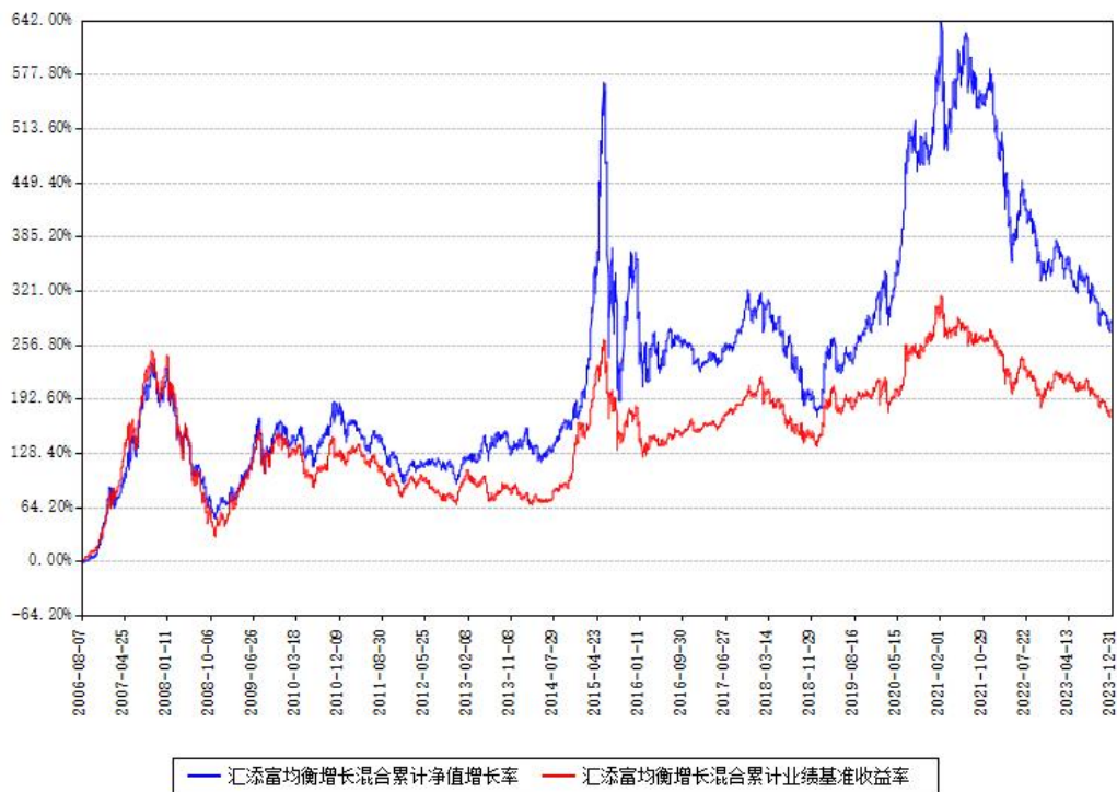
汇添富均衡增长混合累计净值增长率与同期业绩比较基准收益率对比图

注：本基金建仓期为本《基金合同》生效之日（2006年08月07日）起6个月，建仓期结束时各项资产配置比例符合合同约定。