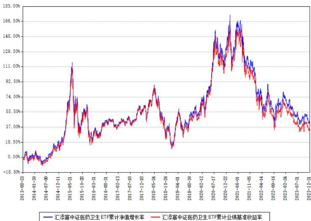
汇添富中证医药卫生ETF累计净值增长率与同期业绩比较基准收益率对比图

注：本基金建仓期为本《基金合同》生效之日（2013年08月23日）起3个月，建仓期结束时各项资产配置比例符合合同约定。