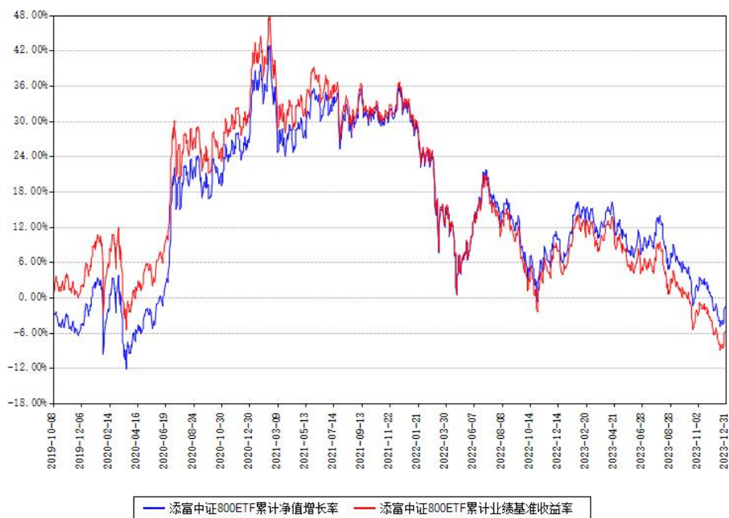
添富中证800ETF累计净值增长率与同期业绩比较基准收益率对比图

注：本基金建仓期为本《基金合同》生效之日（2019年10月08日）起6个月，建仓期结束时各项资产配置比例符合合同约定。