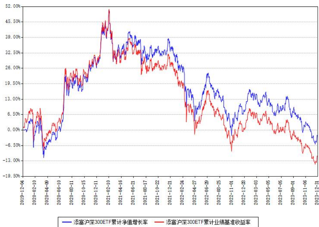
添富沪深300ETF累计净值增长率与同期业绩基准收益率对比图

注：本基金建仓期为本《基金合同》生效之日（2019年12月04日）起6个月，建仓期结束时各项资产配置比例符合合同约定。