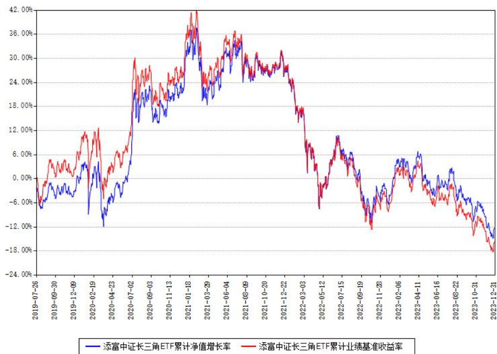
添富中证长三角ETF累计净值增长率与同期业绩比较基准收益率对比图

注：本基金建仓期为本《基金合同》生效之日（2019年07月26日）起6个月，建仓期结束时各项资产配置比例符合合同约定。