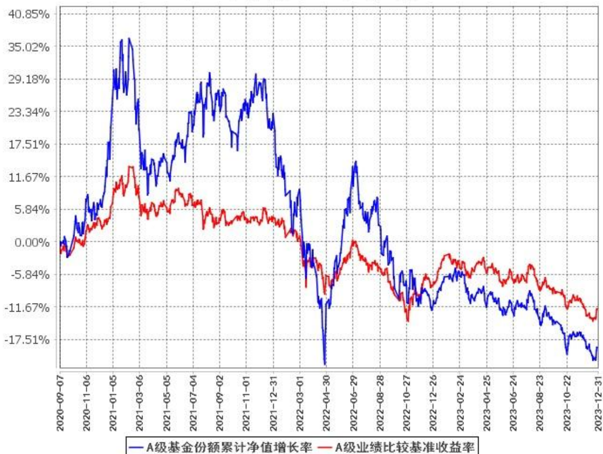
A级基金份额累计净值增长率与同期业绩比较基准收益率的历史走势对比图 (2020年9月7日至2023年12月31日)