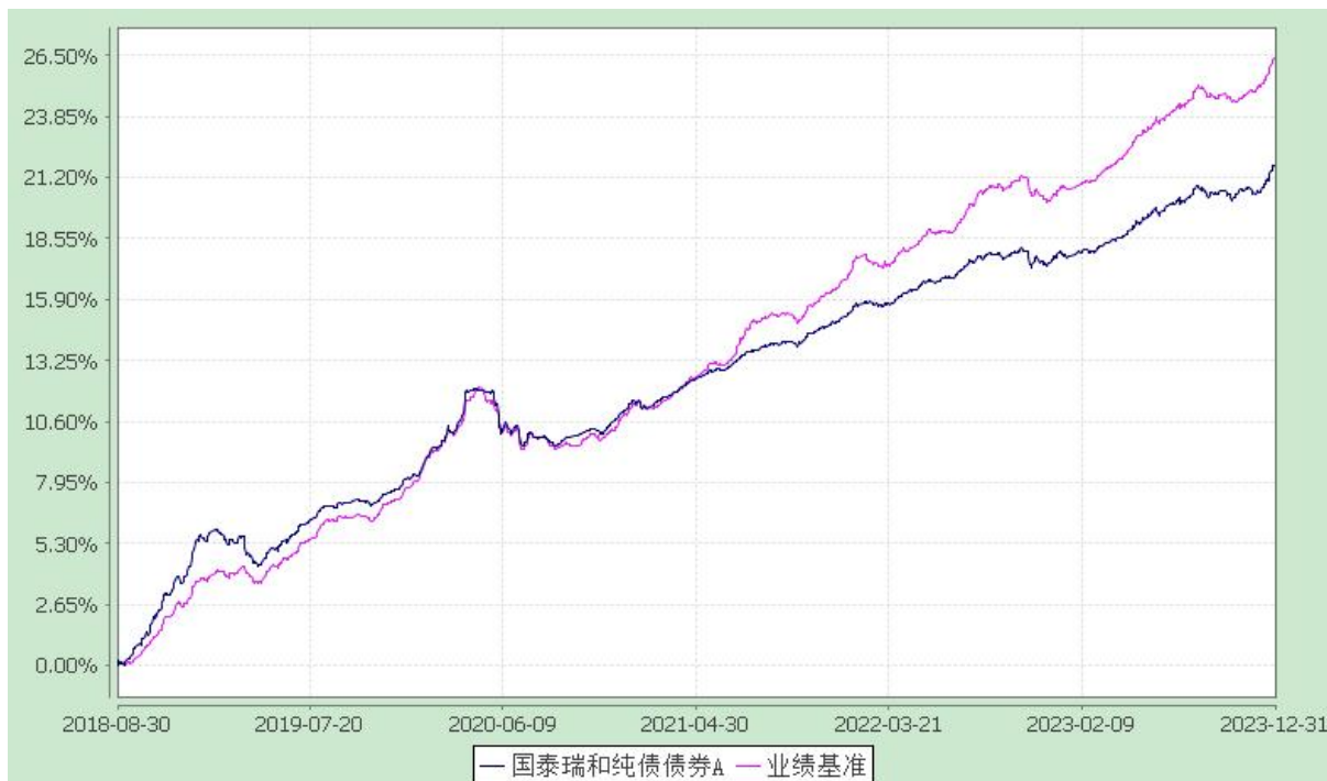
自基金合同生效以来份额累计净值增长率与业绩比较基准收益率的历史走势对比图 (2018 年 8 月 30 日至 2023 年 12 月 31 日)

注：本基金合同生效日为 2018 年 8 月 30 日。本基金在 6 个月建仓结束时，各项资产配置比例符合合同约定。