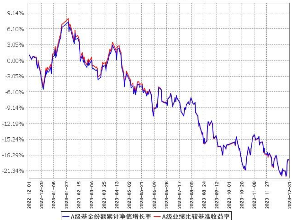
A级基金份额累计净值增长率与同期业绩比较基准收益率的历史走势对比图 (2022年12月1日至2023年12月31日)