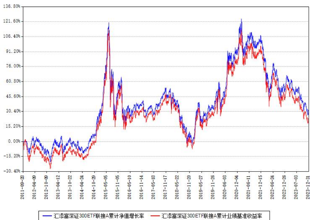
汇添富深证300ETF联接A累计净值增长率与同期业绩基准收益率对比图