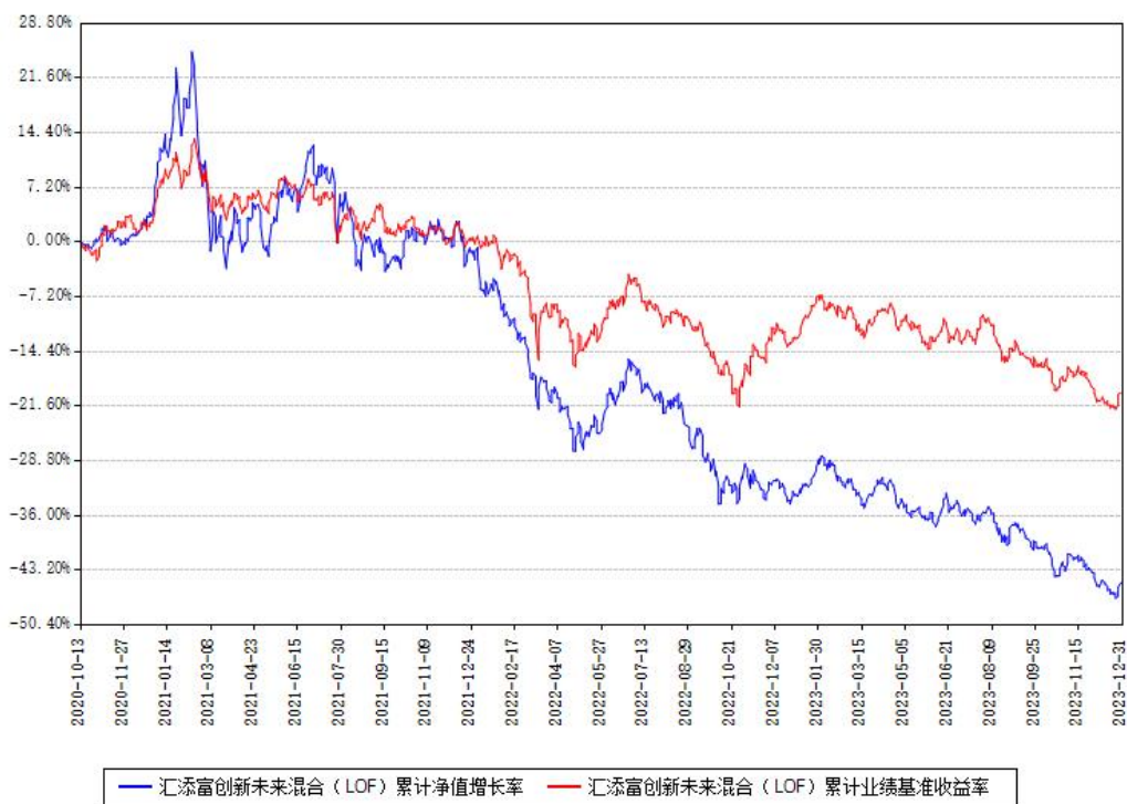
汇添富创新未来混合（LOF）累计净值增长率与同期业绩比较基准收益率对比图

注：本基金建仓期为本《基金合同》生效之日（2020年10月13日）起6个月，建仓期结束时各项资产配置比例符合合同约定。