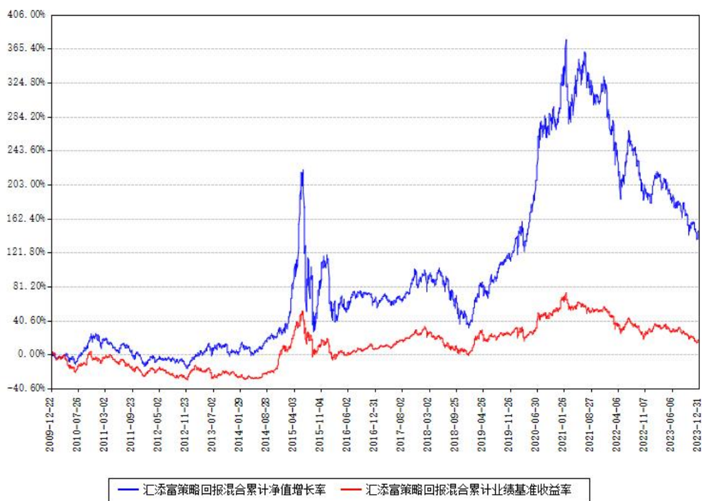
汇添富策略回报混合累计净值增长率与同期业绩基准收益率对比图

注：本基金建仓期为本《基金合同》生效之日（2009年12月22日）起6个月，建仓期结束时各项资产配置比例符合合同约定。