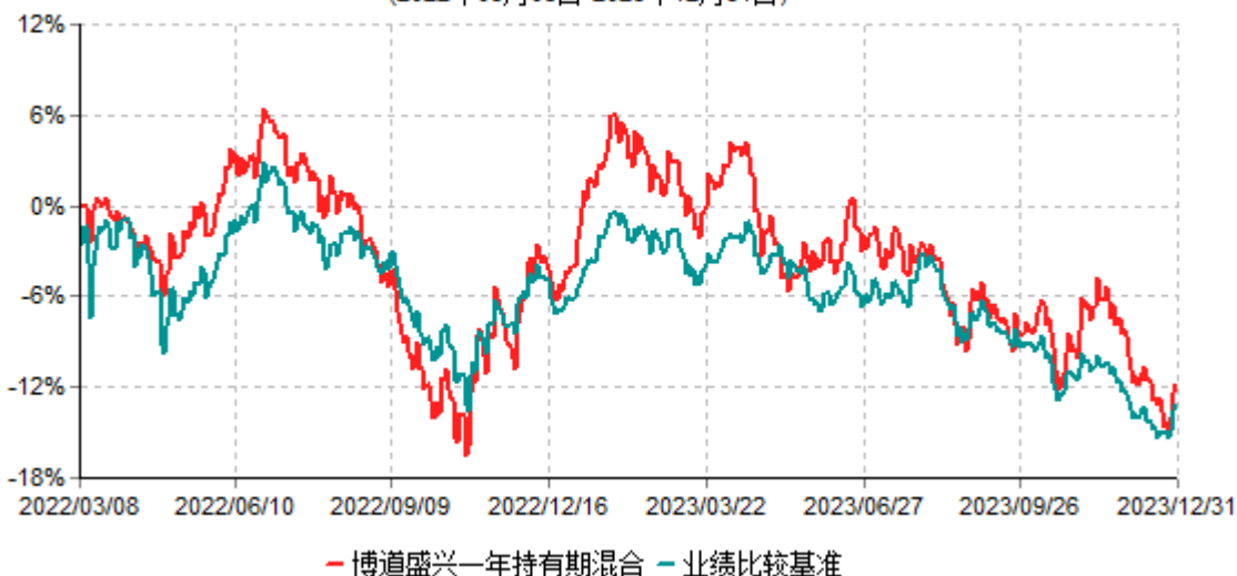
博道盛兴一年持有期混合型证券投资基金累计净值增长率与业绩比较基准收益率历史走势对比图 (2022年03月08日-2023年12月31日)

注:本基金建仓期为自基金合同生效日起的6个月。截至建仓期结束,本基金各项资产配置比例符合基金合同及招募说明书有关投资比例的约定。