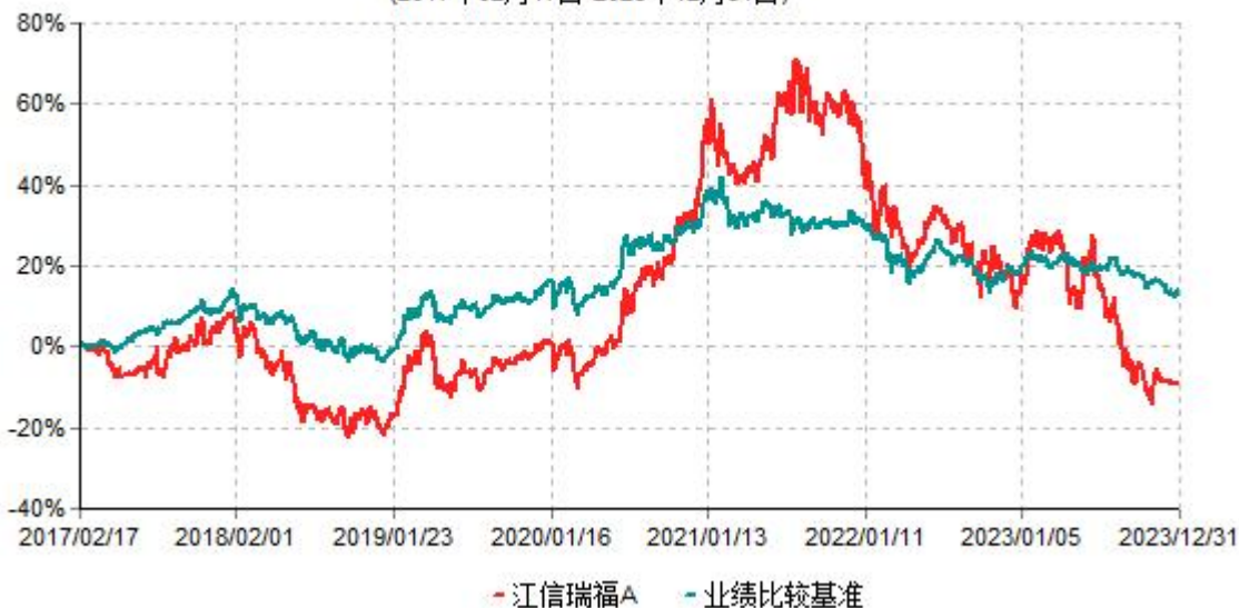
江信瑞福A累计净值增长率与业绩比较基准收益率历史走势对比图 (2017年02月17日-2023年12月31日)