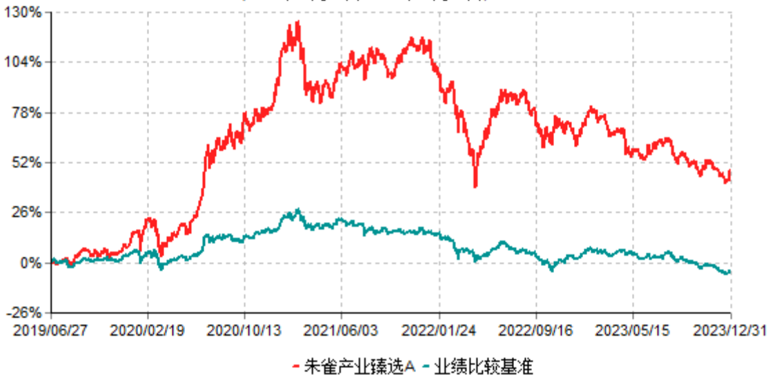
朱雀产业臻选A累计净值增长率与业绩比较基准收益率历史走势对比图 (2019年06月27日-2023年12月31日)