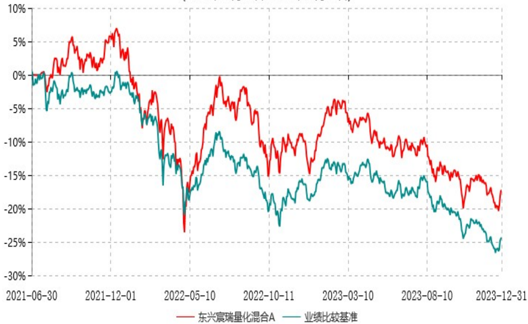
东兴宸瑞量化混合C累计净值增长率与业绩比较基准收益率历史走势对比图