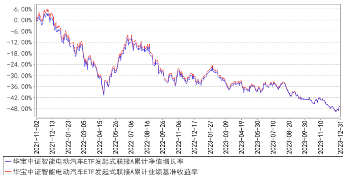
华宝中证智能电动汽车ETF发起式联接A累计净值增长率与同期业绩比较基准收益率的历史走势对比图