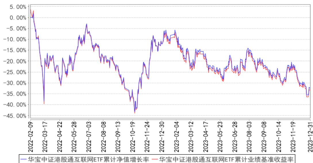
华宝中证港股通互联网ETF累计净值增长率与同期业绩比较基准收益率的历史走势图

注：按照基金合同的约定，基金管理人应当自基金合同生效之日起6个月内使基金的投资组合比例符合基金合同的有关约定，截至2022年08月09日，本基金已达到合同规定的资产配置比例。