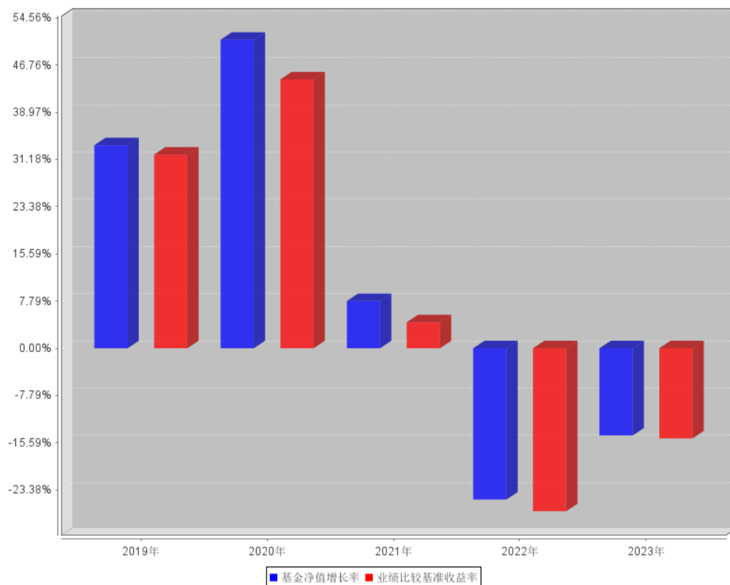
过去五年基金每年净值增长率及其与同期业绩比较基准收益率的对比图