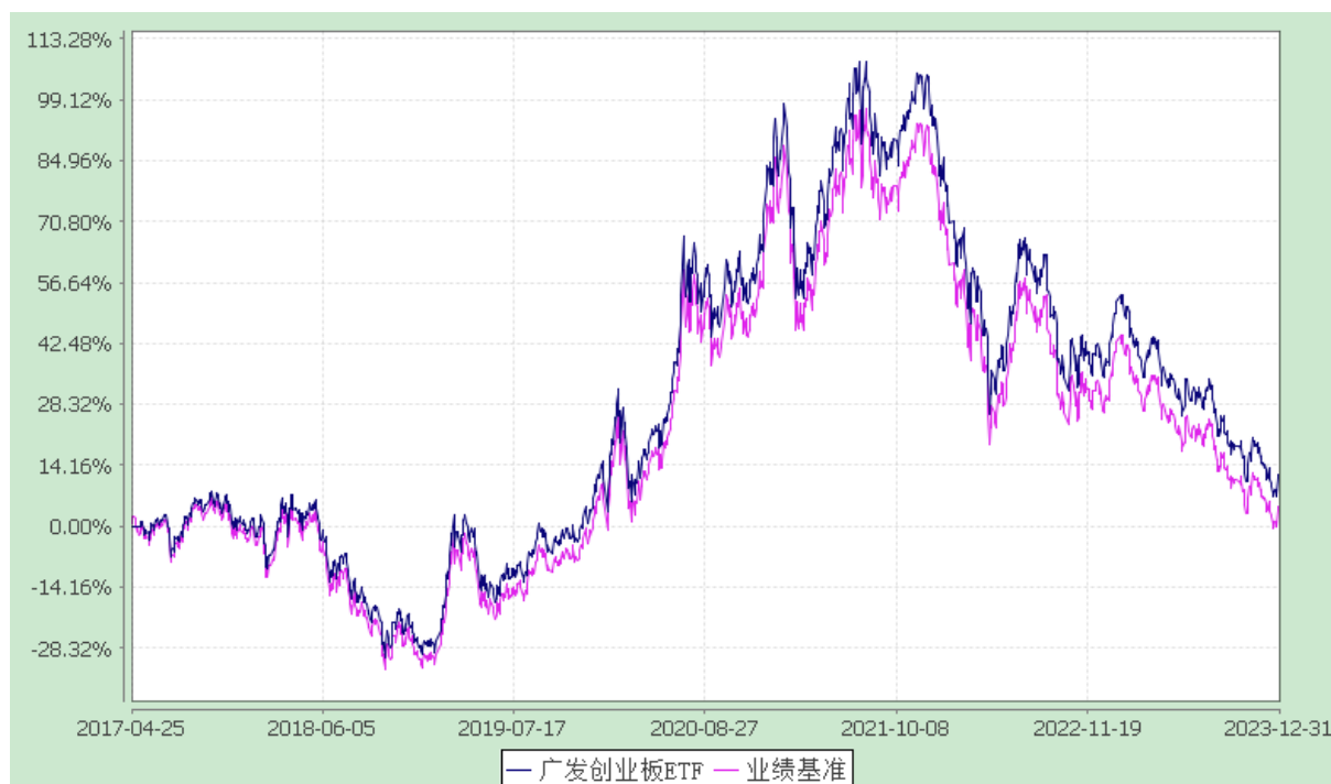
广发创业板交易型开放式指数证券投资基金 份额累计净值增长率与业绩比较基准收益率的历史走势对比图 (2017年4月25日至2023年12月31日)