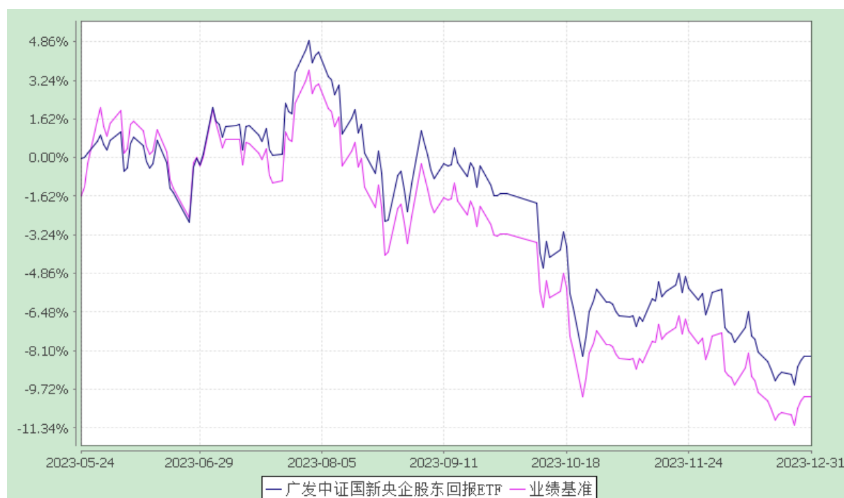
广发中证国新央企股东回报交易型开放式指数证券投资基金 份额累计净值增长率与业绩比较基准收益率的历史走势对比图 (2023 年 5 月 24 日至 2023 年 12 月 31 日)

注：（1）本基金合同生效日期为 2023 年 5 月 24 日，至披露时点未满一年。