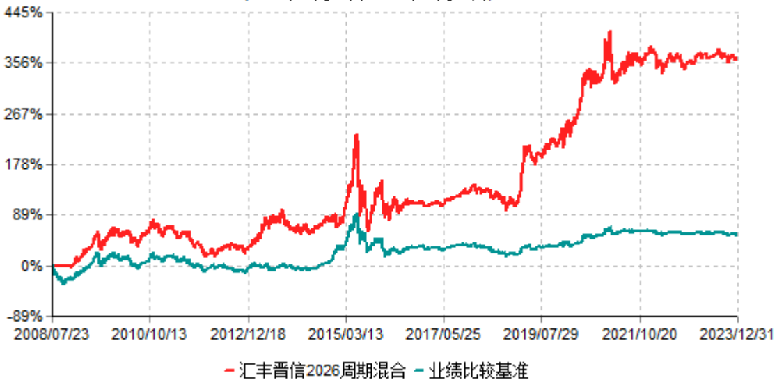
汇丰晋信2026生命周期证券投资基金累计净值增长率与业绩比较基准收益率历史走势对比图 (2008年07月23日-2023年12月31日)