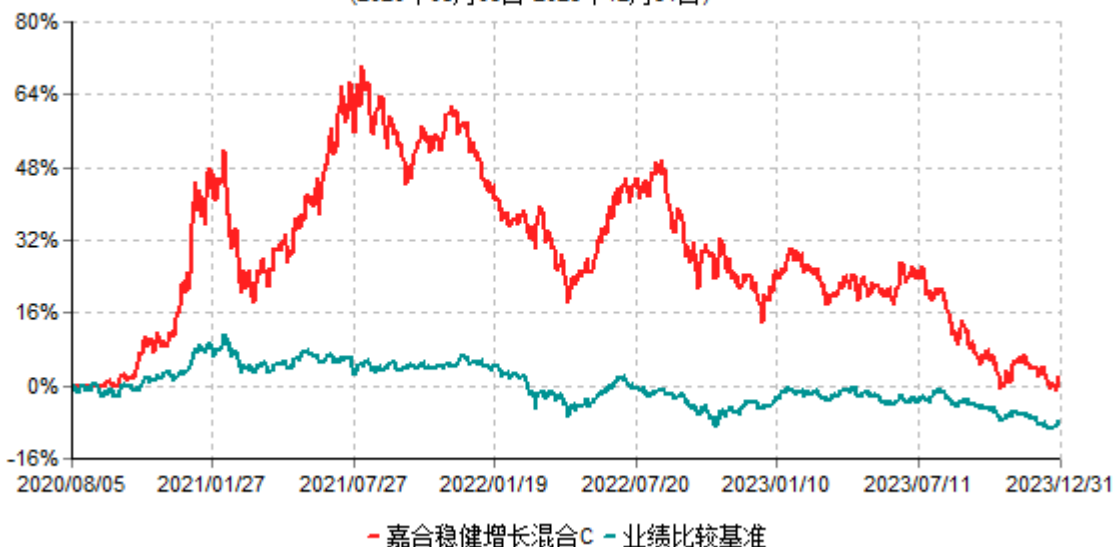
嘉合稳健增长混合C累计净值增长率与业绩比较基准收益率历史走势对比图 (2020年08月05日-2023年12月31日)