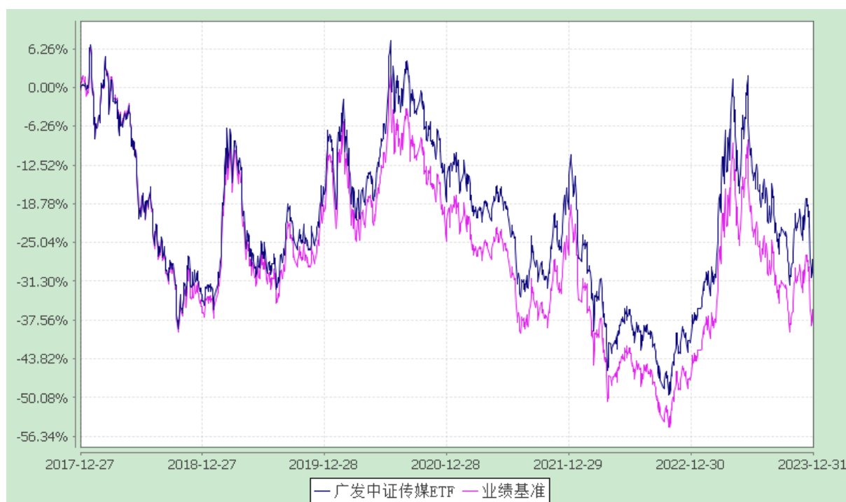
广发中证传媒交易型开放式指数证券投资基金 份额累计净值增长率与业绩比较基准收益率的历史走势对比图 (2017年12月27日至2023年12月31日)