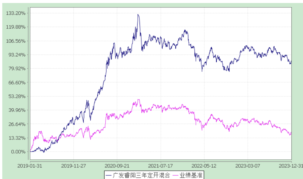
广发睿阳三年定期开放混合型证券投资基金 份额累计净值增长率与业绩比较基准收益率的历史走势对比图 (2019 年 1 月 31 日至 2023 年 12 月 31 日)