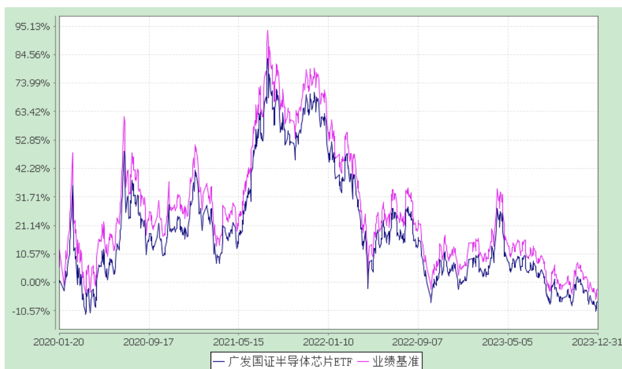
广发国证半导体芯片交易型开放式指数证券投资基金 份额累计净值增长率与业绩比较基准收益率的历史走势对比图 (2020 年 1 月 20 日至 2023 年 12 月 31 日)