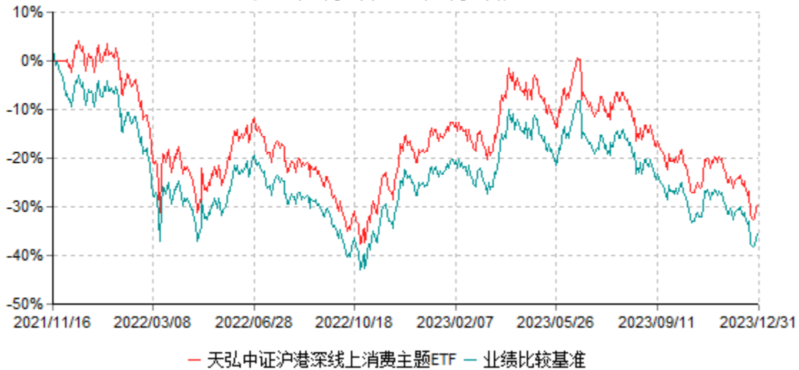
天弘中证沪港深线上消费主题交易型开放式指数证券投资基金累计净值增长率与业绩比较基准收益率历史走势对比图 (2021年11月16日-2023年12月31日)