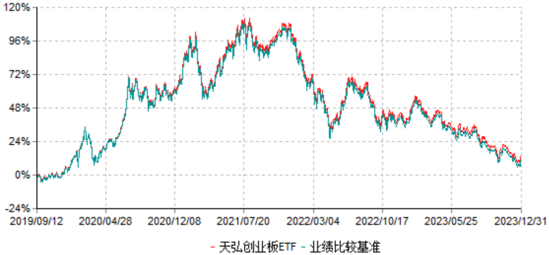
天弘创业板交易型开放式指数证券投资基金累计净值增长率与业绩比较基准收益率历史走势对比图 (2019年09月12日-2023年12月31日)

注：1、本基金合同于2019年09月12日生效。 2、本报告期内，本基金的各项投资比例达到基金合同约定的各项比例要求。