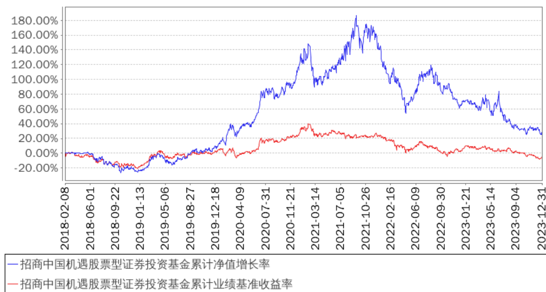
招商中国机遇股票型证券投资基金累计净值增长率与同期业绩比较基准收益率的历史走势对比图