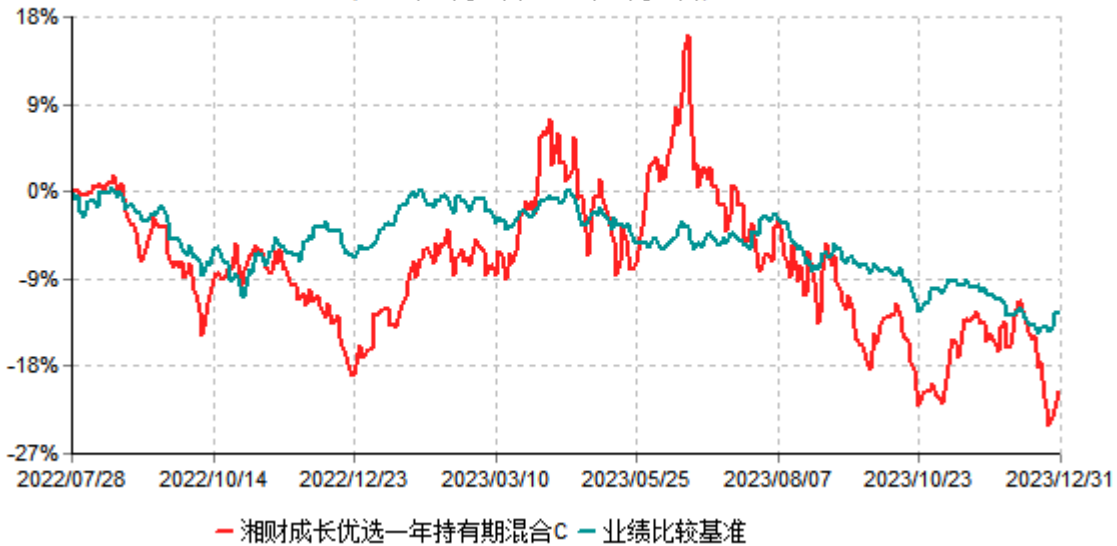
湘财成长优选一年持有期混合C累计净值增长率与业绩比较基准收益率历史走势对比图 (2022年07月28日-2023年12月31日)