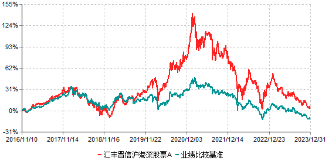
汇丰晋信沪港深股票A累计净值增长率与业绩比较基准收益率历史走势对比图 (2016年11月10日-2023年12月31日)