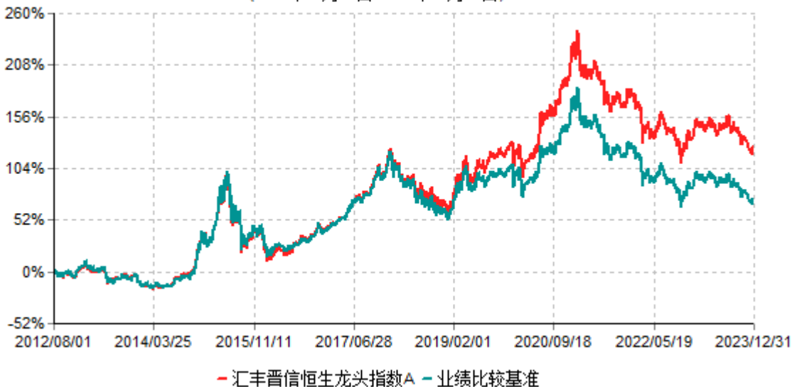
汇丰晋信恒生龙头指数A累计净值增长率与业绩比较基准收益率历史走势对比图 (2012年08月01日-2023年12月31日)