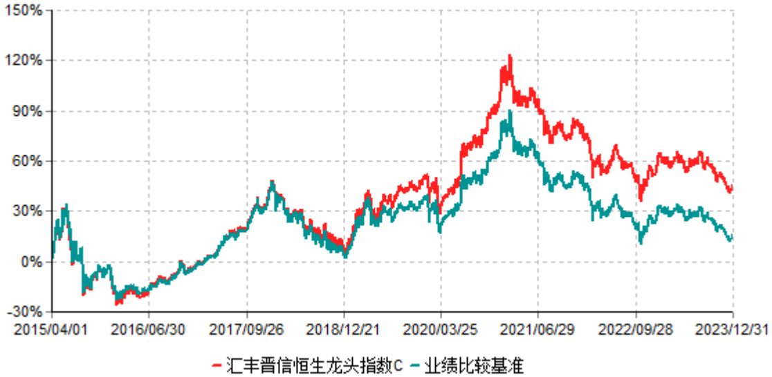
汇丰晋信恒生龙头指数C累计净值增长率与业绩比较基准收益率历史走势对比图 (2015年04月01日-2023年12月31日)