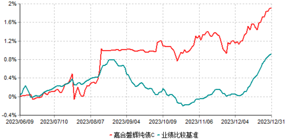
嘉合磐辉纯债C累计净值增长率与业绩比较基准收益率历史走势对比图 (2023年06月09日-2023年12月31日)