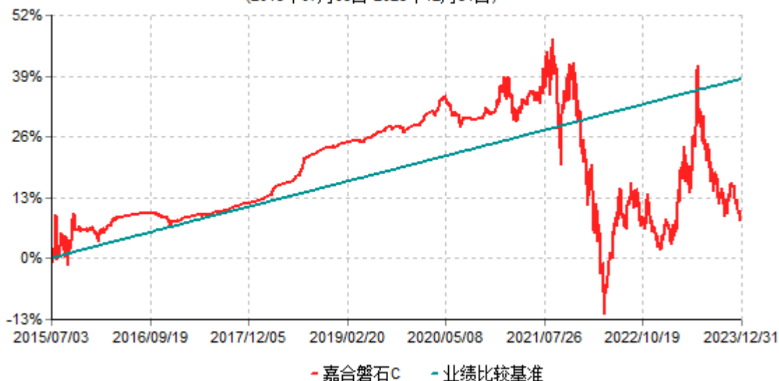
嘉合磐石C累计净值增长率与业绩比较基准收益率历史走势对比图 (2015年07月03日-2023年12月31日)