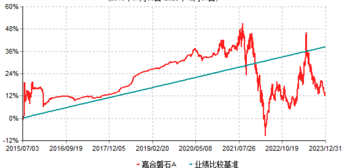
嘉合磐石A累计净值增长率与业绩比较基准收益率历史走势对比图 (2015年07月03日-2023年12月31日)