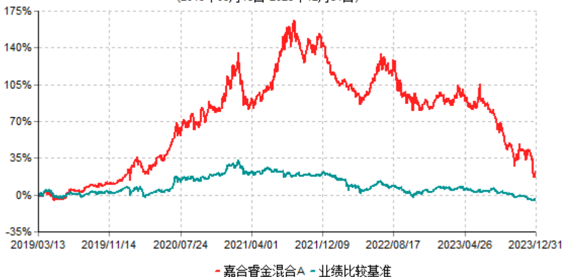
嘉合睿金混合A累计净值增长率与业绩比较基准收益率历史走势对比图 (2019年03月13日-2023年12月31日)

注：1、本基金于2019年3月13日由"嘉合睿金定期开放灵活配置混合型发起式证券投资基金"转型而来。