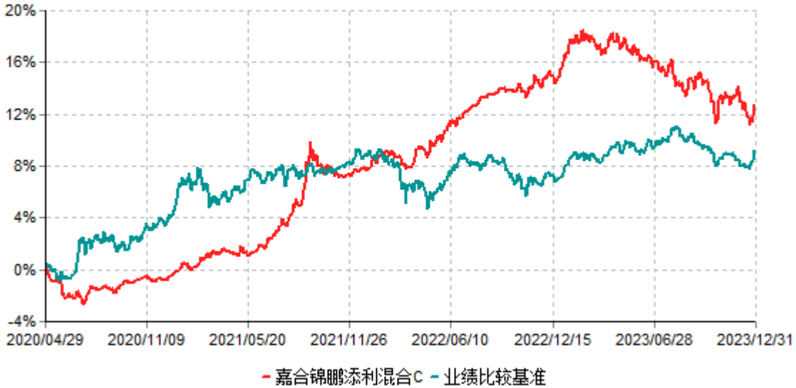
嘉合锦鹏添利混合C累计净值增长率与业绩比较基准收益率历史走势对比图 (2020年04月29日-2023年12月31日)