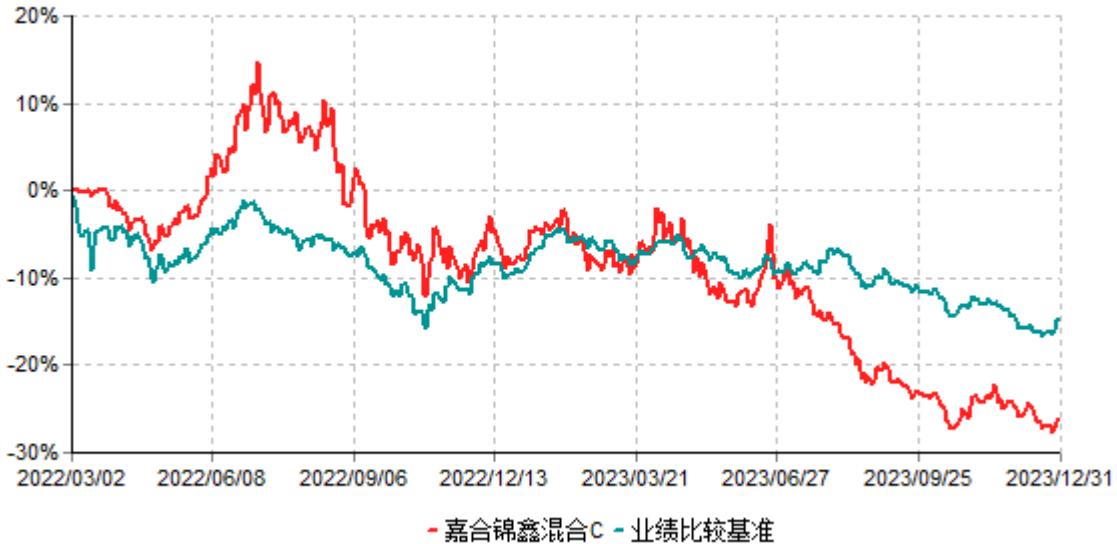
嘉合锦鑫混合C累计净值增长率与业绩比较基准收益率历史走势对比图 (2022年03月02日-2023年12月31日)