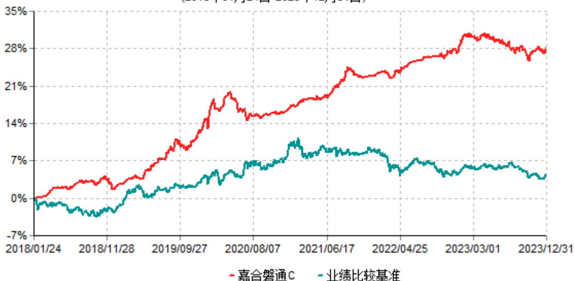
嘉合磐通C累计净值增长率与业绩比较基准收益率历史走势对比图 (2018年01月24日-2023年12月31日)