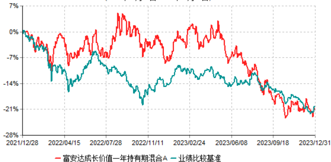
富安达成长价值一年持有期混合A累计净值增长率与业绩比较基准收益率历史走势对比图 (2021年12月28日-2023年12月31日)