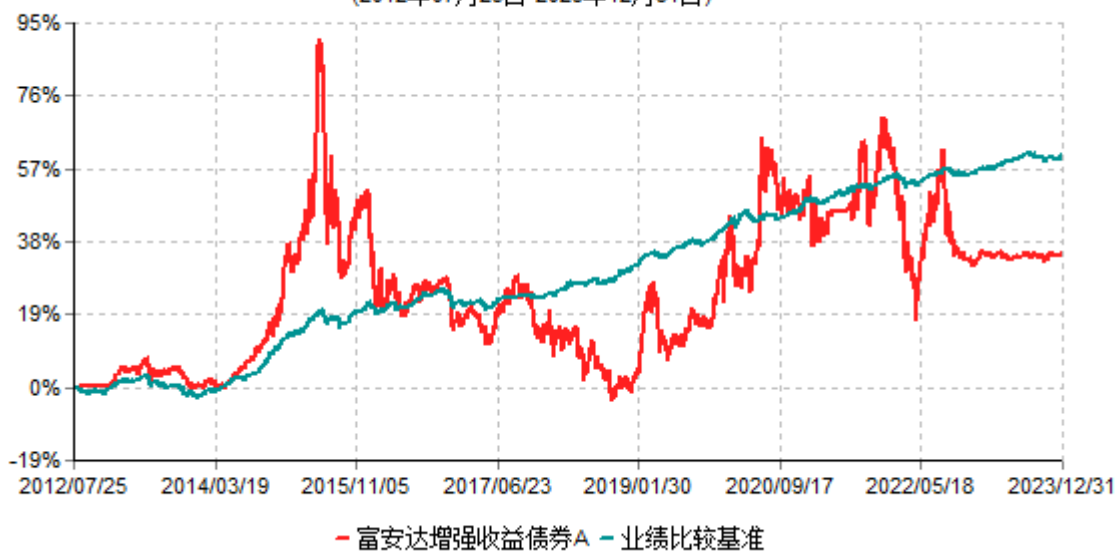
富安达增强收益债券A累计净值增长率与业绩比较基准收益率历史走势对比图 (2012年07月25日-2023年12月31日)