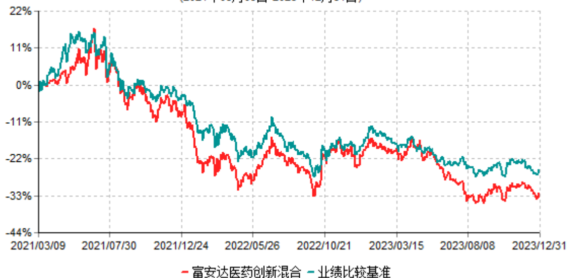
富安达医药创新混合型证券投资基金累计净值增长率与业绩比较基准收益率历史走势对比图 (2021年03月09日-2023年12月31日)